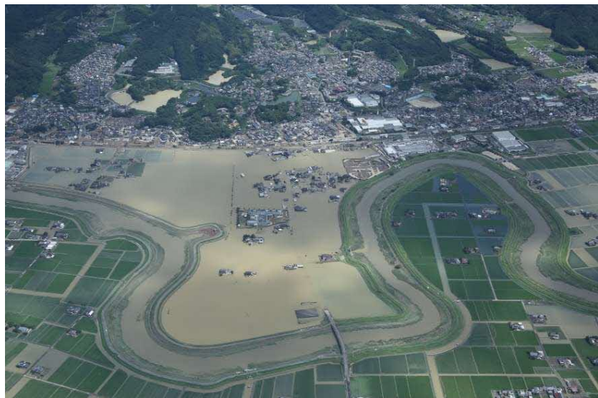
令和3年8月豪雨（佐賀県武雄市）