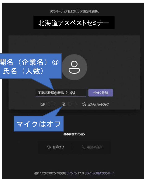
参加前のブラウザ画面