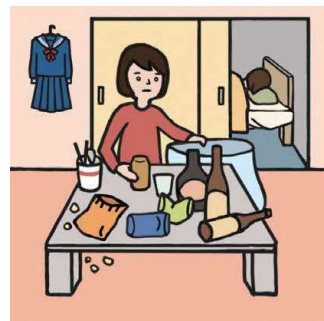
アルコール・薬物・ギャンブル問題を抱える家族に対応している

© 一般社団法人日本ケアラー連盟 / illustration : Izumi Shiga