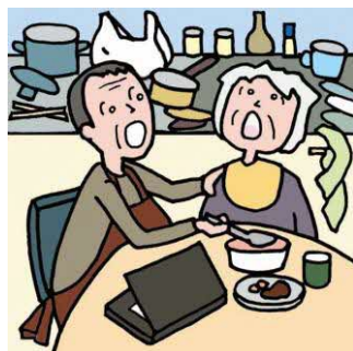
仕事を辞めてひとりで親の介護をしている