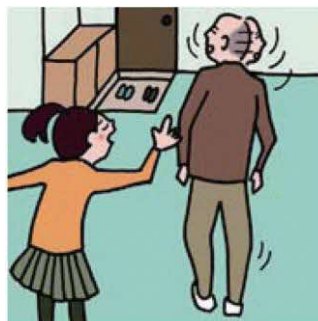
目を離せない家族の見守りなどのケアをしている