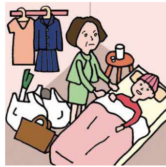
仕事と介護でせいっぱいでほかに何もできない