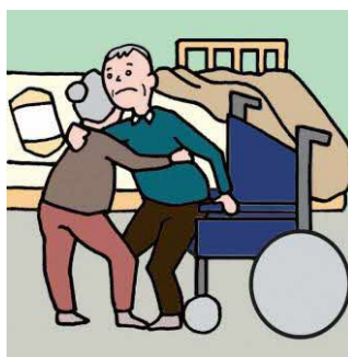
健康不安を抱えながら高齢者が高齢者をケアしている