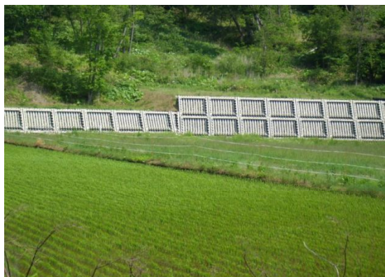
「コンクリート片法枠」