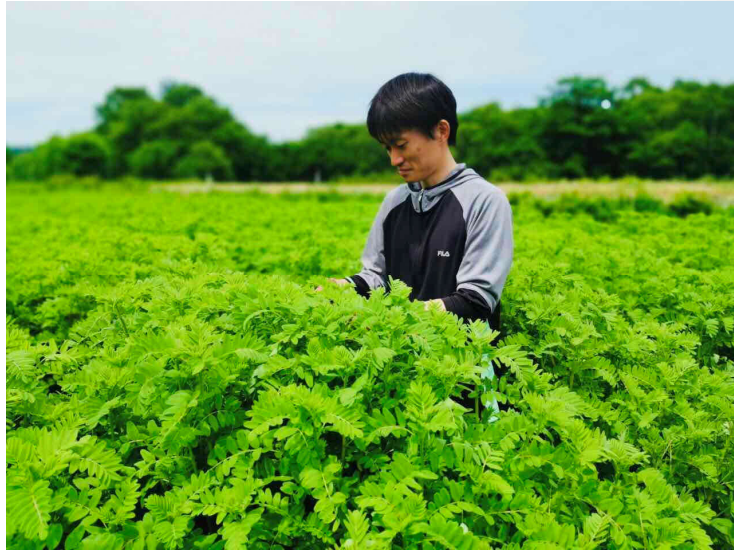
日向氏と畑の様子（植物はキバナオウギ）