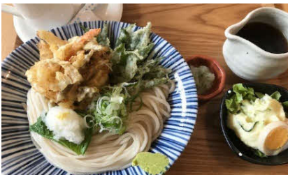
北見市レストランの「やくぜんうどん」