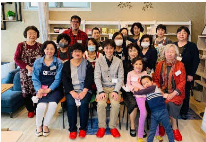
帯広の健康カフェにて講演会の講師を務めた