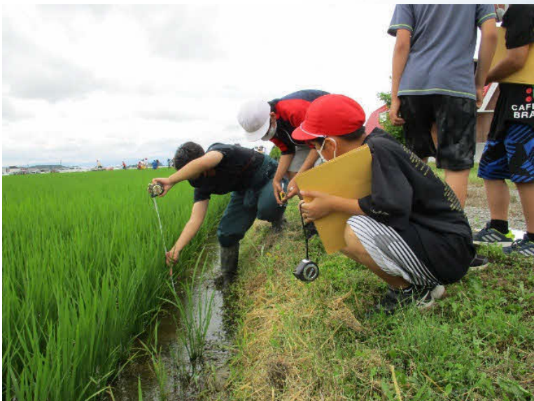
稲の生育観察と田んぼに棲む生き物観察