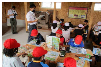
農業・農村の持つ多面的機能の学習