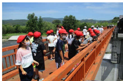
大雪頭首工施設見学会