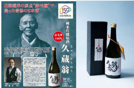
赤毛米の日本酒「久蔵翁」