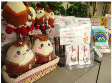
キャラクター「まいピー」のグッズ商品類