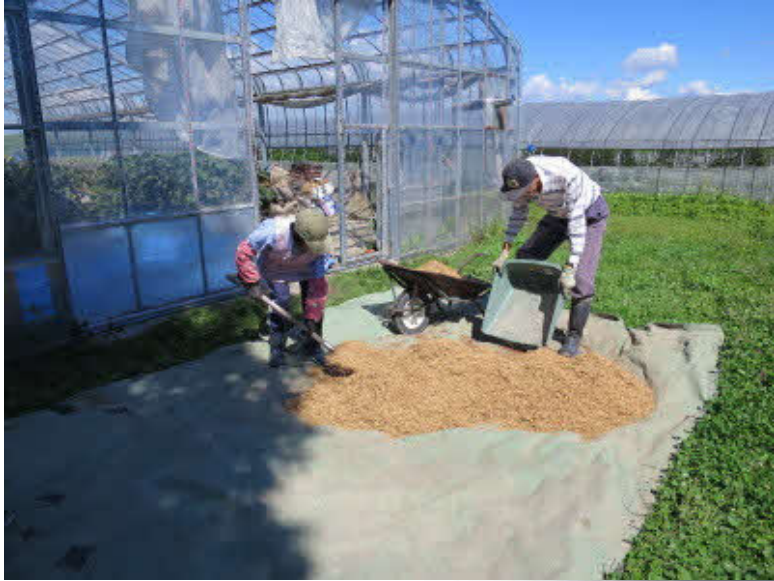
赤毛米の収穫、手作業による自然乾化作業