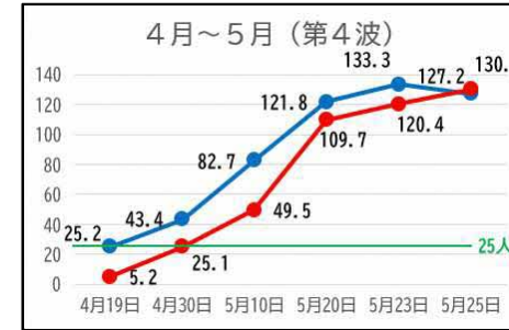
○10万人あたり新規感染者数の推移

◇ 前回、GW（長期休暇）明けに急増 → 夏休み明けとなる 今後、さらに急増する恐れ