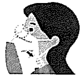
②あご下まで伸ばし顔に すき間なくフィットさせる