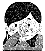
①鼻の形に合わせ すき間をふさぐ