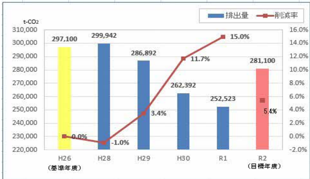
図1 第4期実行計画期間中(H28～R2)の温室効果ガス排出量の推移