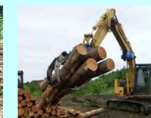
宮田木材 穂別安住273-2 素材生産・造林 従業員 13名