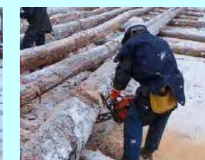
紀藤林業 穂別210-11 素材生産・造林 従業員 9名