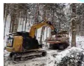
鬼頭木材工業(株) 晴海町37 素材生産・造林・製材 従業員 38名