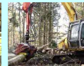
(株) サカマキ 晴海106 素材生産・造林・その他 従業員 10名