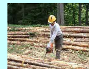
宮崎木材 穂別豊田28 素材生産・造林 従業員 8名