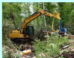
(株) 小玉 栄町2丁目2-10 素材生産・造林 従業員 21名