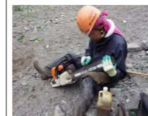
(株) マルコ小林 早来大町21 素材生産 従業員 8名