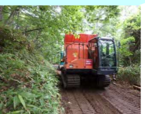
(株) 遠藤組 日の出町8-15 造林 従業員 24名