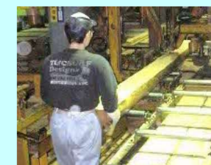
苫小牧広域森林組合 穂別433 製材 従業員