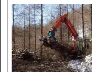
(有) 丹羽林業 字豊丘269-8 素材生産・造林 従業員 8名