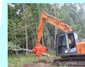
(有) 七尾重機 穂別62-2 素材生産 従業員 12名