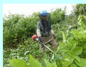
(株) 佐々木林業 字礼文華433-3 素材生産・造林 従業員 8名