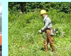
長尾工業(株) 穂別和泉141-4 素材生産・造林 従業員 87名