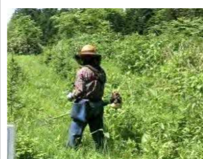
大浦木材(株) 末広町1丁目5-27 素材生産・造林・製材 従業員 35名