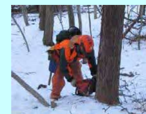
(株) 上村総業 穂別稲里721 素材生産 従業員 7名