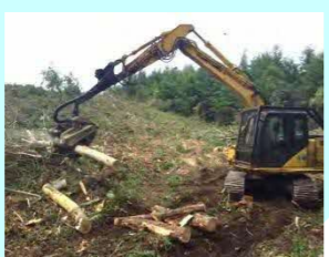
佐藤杭材 音羽町2丁目19-4 素材生産・造林 従業員 4名