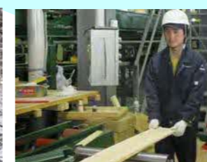
(株) ヨシダ あけぼの町3丁目4-7 製材 従業員 35名