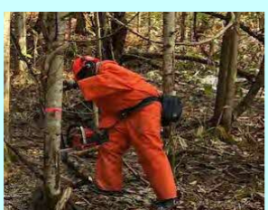
豊浦林業(株) 字大岸135-19 素材生産・造林 従業員 8名