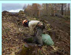
胆振西部森林組合 大滝区本町85-2 素材生産・造林・その他 従業員 16名