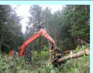
(株) 大滝林業 大滝区優徳町93-18 素材生産 従業員 2名