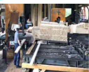
(株) 丹治秀工業 字植苗192-2 素材生産・造林・製材 従業員 14名