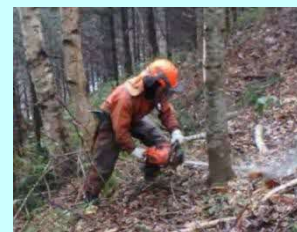
(株) イワクラ 晴海町23-1 素材生産・造林・その他 従業員 130名