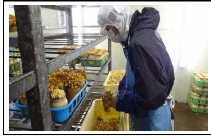
企業での作業学習：きのこ栽培