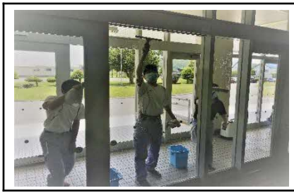
作業学習：清掃作業