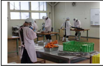
作業学習：食品乾操作業