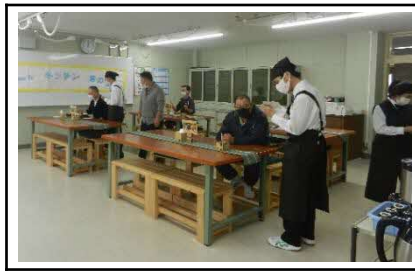
作業学習：食堂サービスでの接客