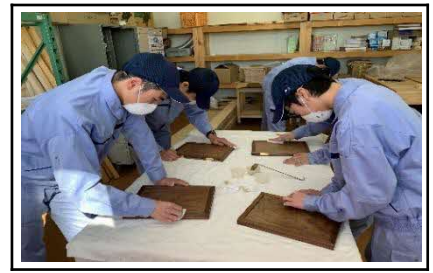
作業学習：木工作業