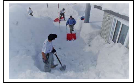
作業学習：除雪作業