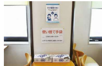
(朝食レストランにあるビニールの手袋)

何よりもまず、「新北海道スタイル」に準拠した取組の徹底を図っています。パブリックなエリアでは、エントランスにて検温と手指消毒をお願いすると同時に、お客様と対面するフロントカウンターには飛沫感染防止のパーテーションを設置しています。また、チェックインなどでお並びいただく際にソーシャルディスタンスを確保するため、フロアに立ち位置の目印となるマーカーを設けています。さらに、各階のエレベーターホールに、手指用の消毒剤を設置し、お客様に自由にお使いいただいております。