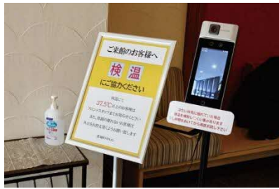
(エントランスで検温と手指消毒を実施)