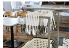
(パンコーナー用トング)