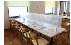
(レストランのパーテーション)

客室内においては、アルコールによる消毒を徹底していますが、さらに気になる部分などを自由に拭いていただけるよう、消臭効果もある消毒剤のスプレーを設置するとともに、ご宿泊人数に合わせてマスクも常備しております。また、朝食の際にレストランが密になることを避けるため、客室のテレビにてレストランの混雑状況がわかるシステムを導入しました。