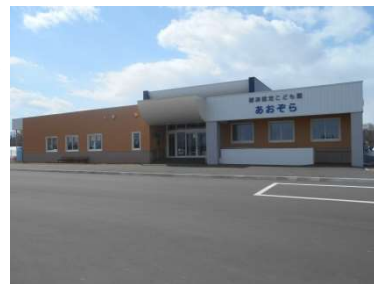
幼保連携型こども園をH28に供用開始