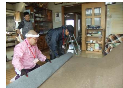
「あんしんサポートセンター」による高齢者の生活支援