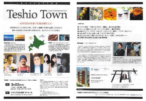
H29.3.22東京九段での試食会