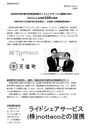
ライドシェアサービス(株)nottecoとの提携