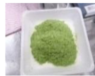
フリーズドライ(試作品)