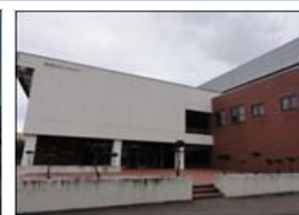
知内町スポーツセンター