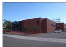
知内町中央公民館