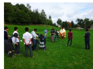
コラボ動画撮影風景