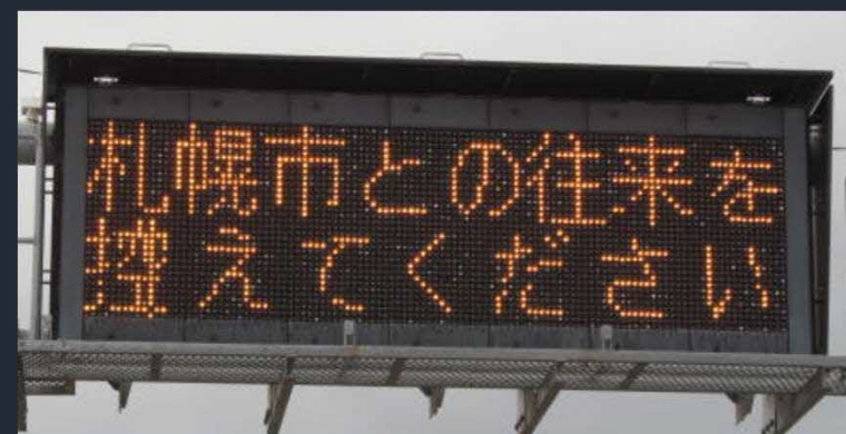
【道道の道路情報板】