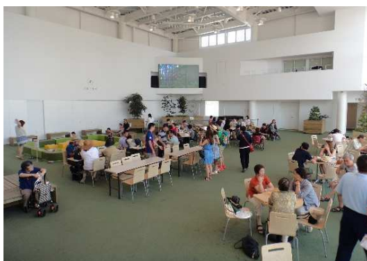
▲全天候型多目的交流空間アトリウム「TAMARIBA(タマリーバ)」

間が得意としているので、任せていたきたい。官民の壁を取っ払い、一体となつてやっていく必要があると思います。