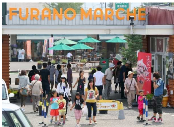
▲人々で賑わうフラノマルシェの様子

私達は、50代、60代を責任世代という言い方をしていますが、私達くらい世代が次の世代にいいまちを残していく