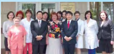
現地スタッフと北斗病院職員