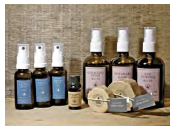
「北海道モミ」のネーミングで人気のアロマ製品

15年ほど前から森林組合の職員を中心に、間伐などの伐採後に残るトドマツの枝葉を有効利用しようと取り組んできた下川町。植物の香りで心身をリラックスさせるアロマセラピーに着目し、製品化に挑戦。現在(株)フプの森ではトドマツの香り成分を活用した精油(天然オイル)やルームスプレー、化粧水、石けんなどを製造販売しています。