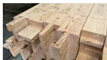
出荷を待つカラマツの建築用材

道内の人工林の約3割※を占めるカラマツは、割れ・ねじれが発生しやすいことから、これまで主に安価な梱包材として使用されてきました。