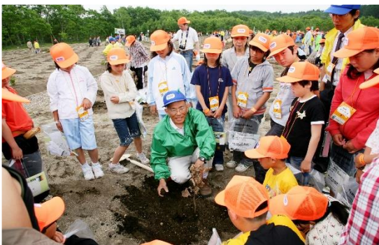
苗木の植え方を勉強