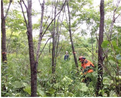
チェーンソーによる除伐 (ハルニレ)