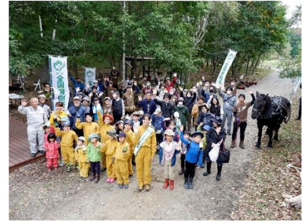
イベント参加者集合！