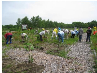
手鎌による下草刈り