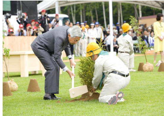
アカエゾマツのお手植え