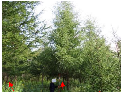
カラマツ アカエゾマツ ゲイマツ雑種F1