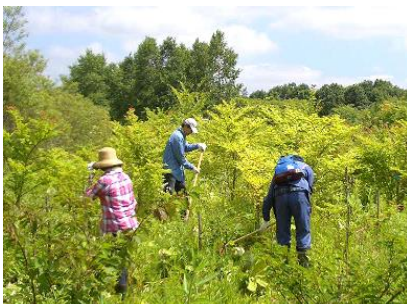
手鎌・大鎌による下草刈り