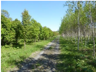
ナナカマド シラカンバ

○ みなさんの手で植樹していただいた木々は、苫小牧東部地域の気象条件などにより成長に差がみられますが、地元の方々やボランティアなどの手でしっかりと守り育てられ、元気に育っています。