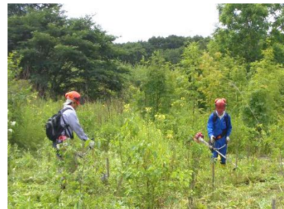
刈払機による下草刈り (低木：ハマナス、チシマザクラ)