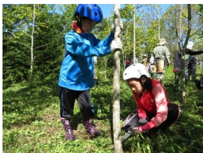
手鋸での除伐体験