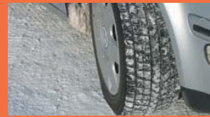
冬天雪道專用輪胎是租車公司車子的標準配備。

在北海道有很多只有冬天才能享受到的樂趣，如滑雪、滑雪板和雪中露天溫泉等等。因此所攜帶的防寒衣物或道具等等也相當多。所以利用租車來移動是非常有用的。雖然這麼說，但是冬天道路的駕駛難度相當高。為避免引起不必要的糾紛，事事先做好基本知識的準備功課吧。