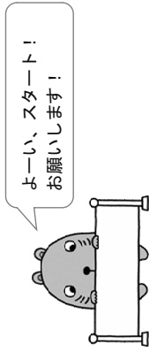
北海道庁保健福祉部のキャラクター 「うっさん」(ウキウキ)