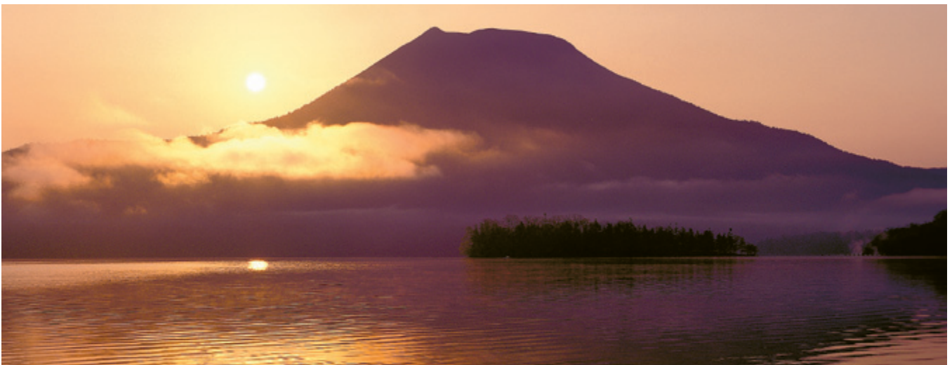
朝日を浴びた阿寒湖と雄阿寒岳