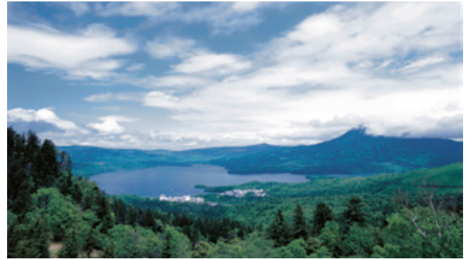
南から見た阿寒湖