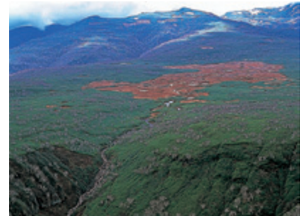
下流から遠望する雨竜沼湿原の全景