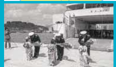
蟹田港で行われたむつ湾フェリーの発船式。背後の山は野東山 (1980 (昭和55) 年4月10日、青森県史編さん資料)