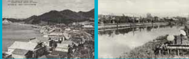
浅虫温泉 (昭和戦前期) 八幡宮の境内から駅方面を見たもの。現在も境内からは浅虫温泉駅を眺望できる。 湯の川温泉 (昭和戦前期) 湯の川の河口付近から、竹浦橋 (現在は月島橋) を臨む。現在の湯の川駅北ホアが付近である。

青森市：浅虫温泉は青森の奥座敷として有名に。戦後の観光ブームに乗り「東北の熱海」と称された「海の温泉」。 函館市：当時の湯の川温泉は函館の奥座敷として松倉川付近に展開した「川の温泉」。