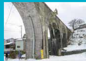
「幻の双子鉄道」にも大間線の橋脚 (2016 (平成28) 年1月28日)