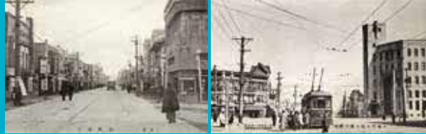
青森市の駅前通り (昭和戦前期・中園祐氏 提供) 手前が青森駅方面で右端の建物は甘崎室 (かんせいど) 手前が駅前が狭路通りである。 函館市の大門「たいもん」通り (昭和戦前期・中園祐氏 提供) 手前が函館駅方面で左が五枝郭方面。大門には文字通り大きな門があったが、1934 (昭和9) 年の大火で消失した。

青森市：1910 (明治43) 年の大火で市街地がほぼ全滅する被害を受けた。耐火性の高い建造物を中心とする街並みへ変わり、繁華街は浜町棧橋付近の大町や浜町から、大火後、次第に駅前の新町へ西進。 函館市：1934 (昭和9) 年の大火で街並みの3分の1が焼失。大火後、復興事業の推進により、繁華街は明治期から昭和戦前期にかけて西部地区の旧棧橋から東部地区の函館駅周辺へ東進。