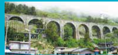
函館市で撮影した大間線の橋脚 (2010 (平成22) 年5月30日)