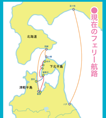
現在のフェリー航路

参考 「山川草木ことごとく 155」(『毎日新聞 青森版』2017年11月23日付)