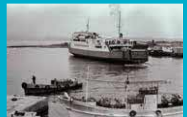
函館へ向けて大間港を出発するフェリー。大間町長をはじめ道下北の各市町村長にとって大切な生活航路だ。(1970 (昭和45) 年9月12日撮影、青森県史編さん資料)