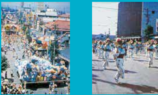
ねぶた祭 (昭和41年・中園祐氏 提供) 青森市：ねぶた祭は、戦後の一時期「青森港祭り」として、港町であることを象徴する祭であった。 函館市：「函館港まつり」は1934 (昭和9) 年の大火からの復興を意図して開催。