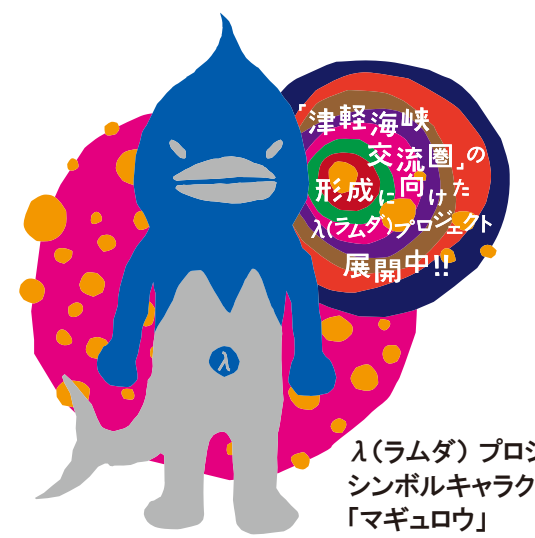
ラムダプロジェクト シンボルキャラクター 「マグロウ」

そして、平成28年3月の北海道新幹線開業が、さらにこの交流を深めるきっかけとなった。人口減少が進む中、お互いの歴史・文化を知り、互いの強み、今あるものを生かしながら、このつながりを確固たる土台に変えていくことが求められている。地域が生き延びていくヒントは津軽海峡を挟んだ両地域の歴史の中にある。