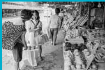
青森駅のりんご市場 りんご以外の果物も売っている。(1972 (昭和47) 年9月9日)

その後、建物の老朽化などに伴い、駅開発の流れの中で、青函連絡船が廃止された翌1989 (平成元) 年5月にりんご市場と、市場につながる長屋風の飲み屋街は撤去された。しかし、町の随所に歴史あるものが存在しており、りんご販売店の数店が今も青森駅近くで営業を続けている。