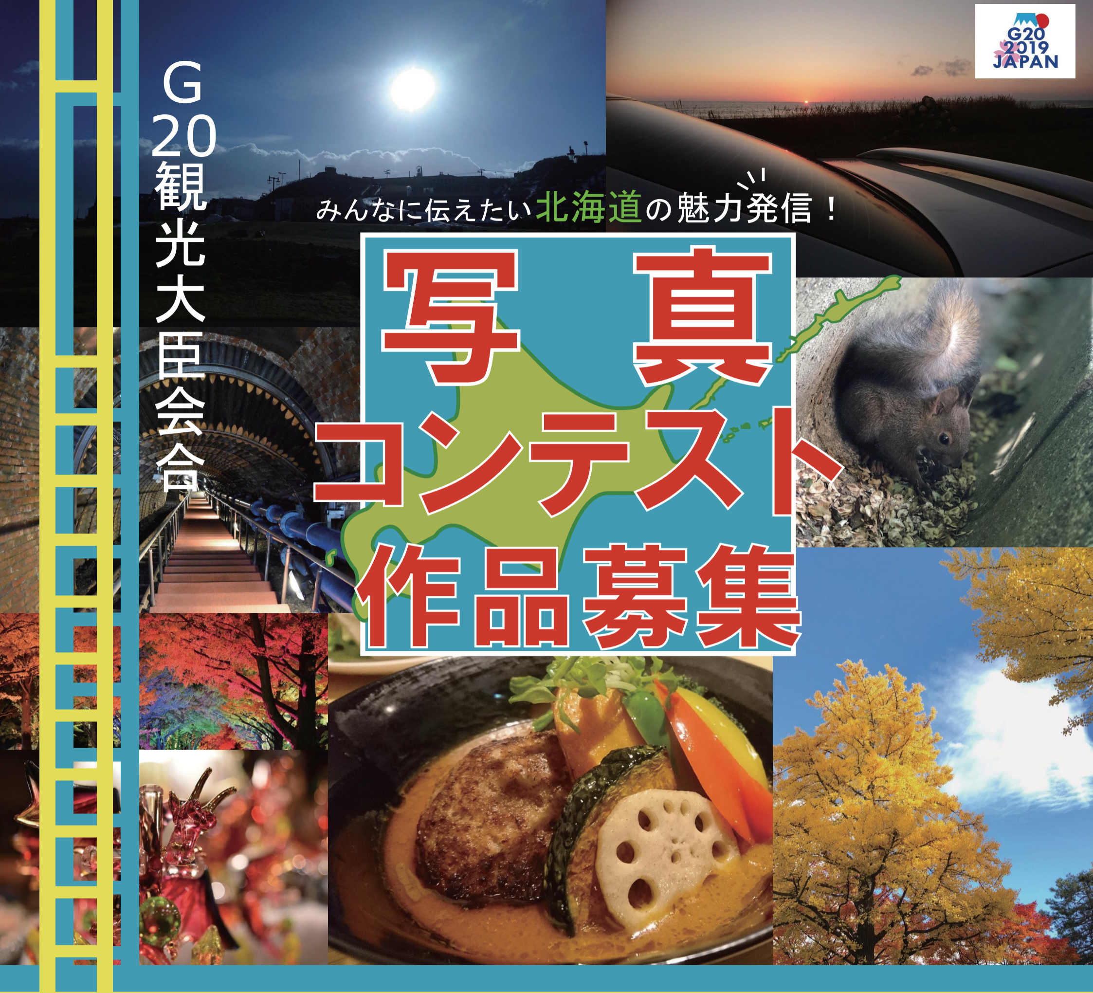
写真 コンテスト 作品募集

2019年10月に北海道・倶知安町で開催されるG20観光大臣会合に併せ、あなたが見つけた北海道の魅力を切りとった写真を募集します。撮った写真にあなたが気づいた魅力をのせて発信して、北海道を観光でさらに日本全国そして世界中にアピールしましょう。知る人ぞ知るスポットや、名所に絶景、特産品や料理のスナップ写真など、魅力発信につながる写真ならどんな写真でも大歓迎です。誰もが北海道を訪れたいくなるような、そんな「あなたが伝えたい北海道の魅力」をコメントに添えて、ぜひ応募してください。