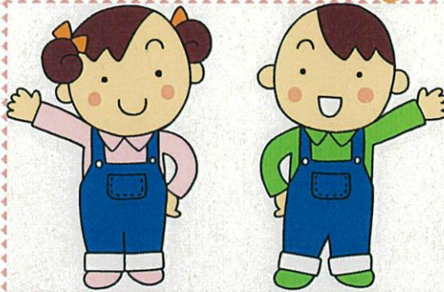
【食品ロス啓発キャラクター】 大地くんとめぐみちゃん