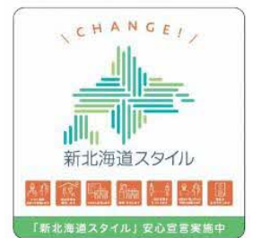
「新北海道スタイル安心宣言実施中」のステッカーデザイン