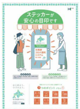
店頭掲示用ポスターデザイン