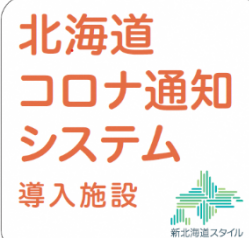
「北海道コロナ通知システム導入施設」のステッカーデザイン