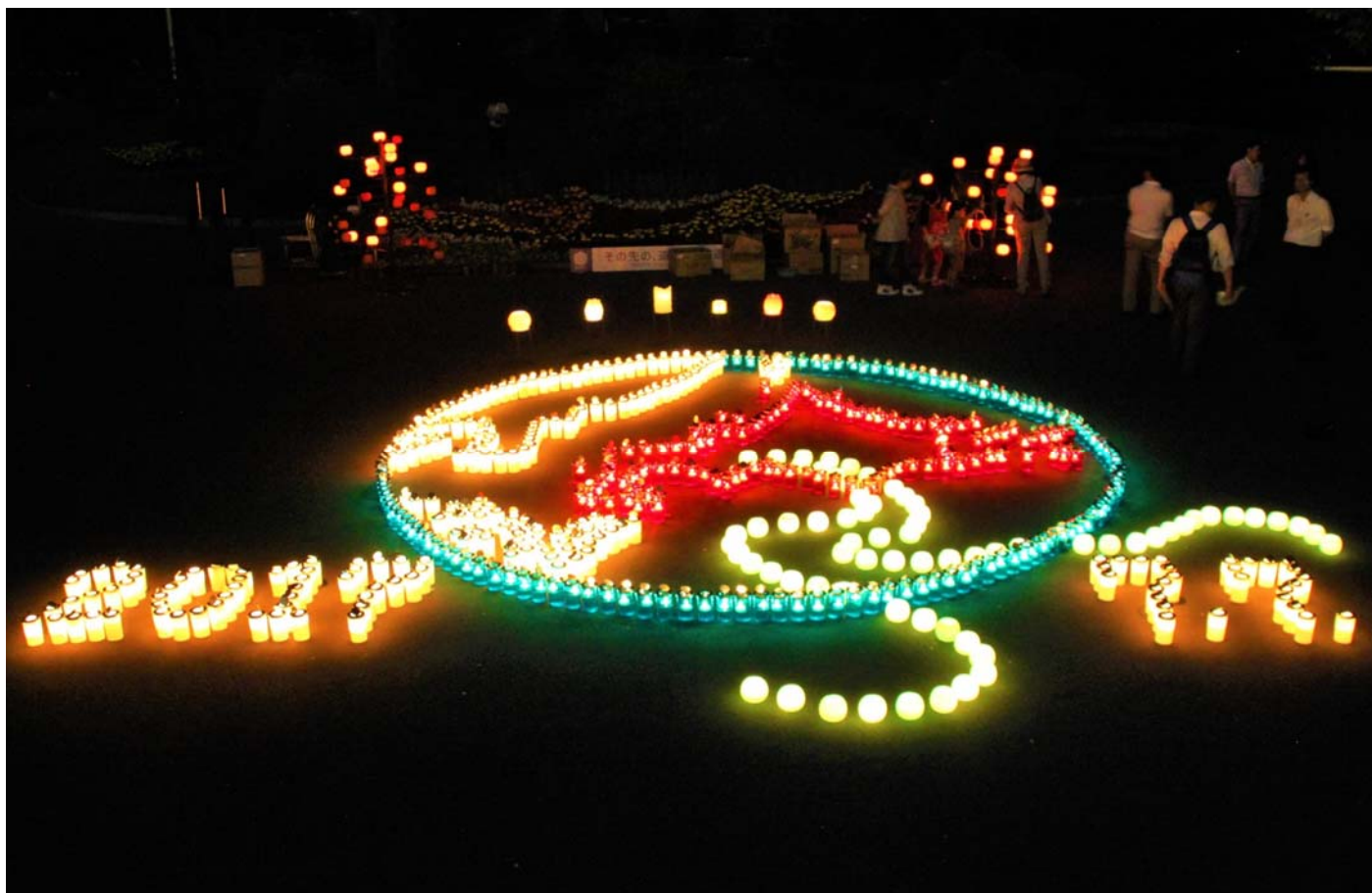
2017年のキャンドルアートのテーマは「その先の、道へ。北海道」 道民の方々、北海道訪れるの方々にとって、北海道には様々な可能性が広がっていること、 そして、北海道が未来や世界に積極的に進んでいこうとする動きを、地球の中の北海道から道が広がるよう表現しています。