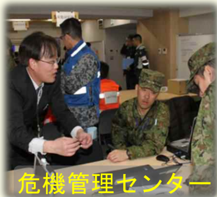
危機管理センター