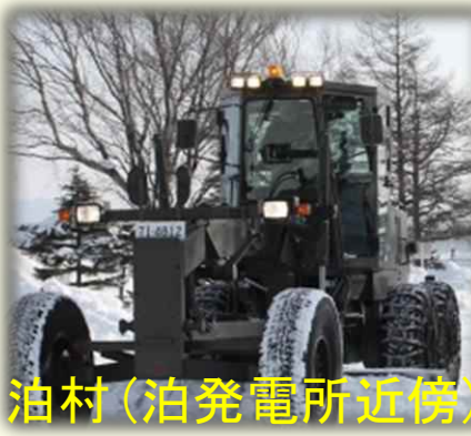
油村(泊発電所近傍)