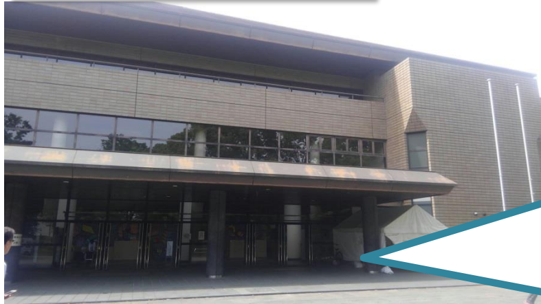
熊本市総合体育館・青年会館 (避難所)