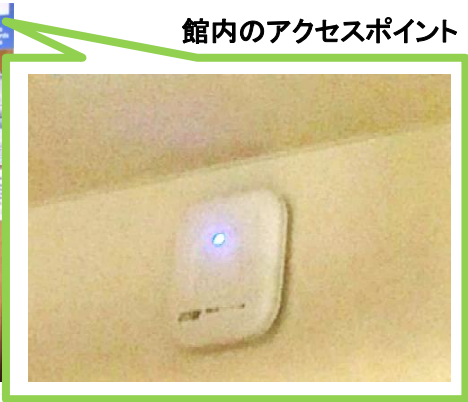
館内のアクセスポイント