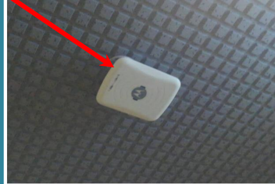
館内のWi-Fiアクセスポイント