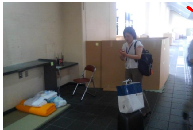
4月14日以降、避難所として利用。 最大で550名(4月16日)が避難。