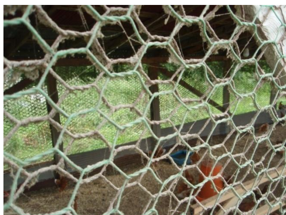
双重使用网眼 2 c m 以上的网的示例

对投放饲料和水的设备进行清扫。投放饲料时注意观察饲料槽有无野生动物排泄物，如发现要及时清扫。