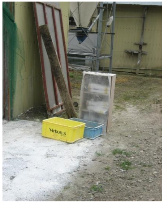
卫生管理区域及鸡舍专用的衣服（白大褂）和长靴的放置示例