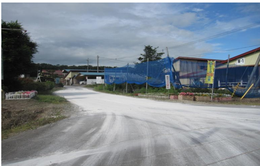
在农场入口撒熟石灰