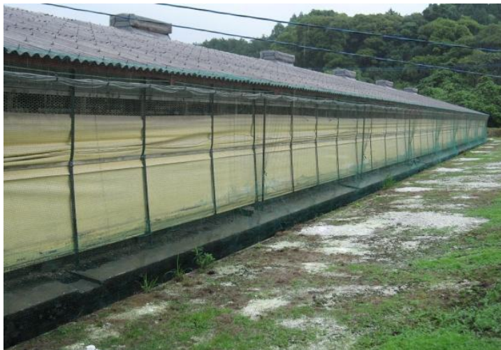
覆盖整个鸡舍的防鸟网