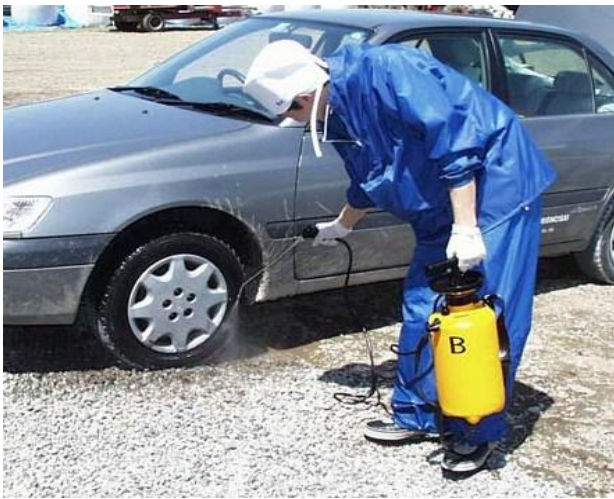
用消毒泵对车辆进行消毒