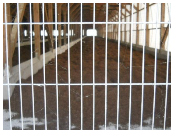
使用间距较小的金属网防止小型鸟侵入的示例