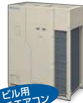
ビル用 マルチエアコン