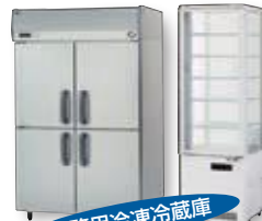
業務用冷凍冷蔵庫