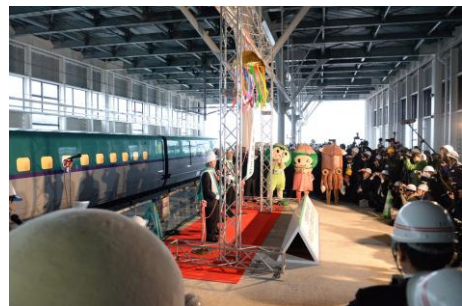
試験走行歓迎セレモニー(H26.12新函館北斗駅)