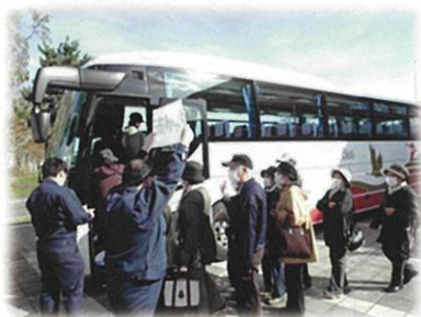
住民避難訓練 (バスによる避難)