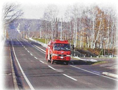
広報訓練 (広報車による広報)