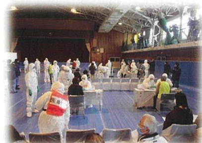
原子力災害医療活動訓練 (避難退域時検査)