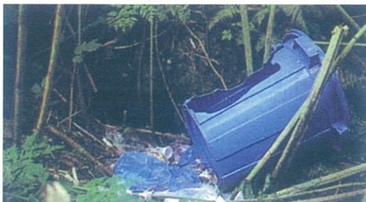
ヒグマに荒らされたゴミバケツ

実際に平成11年～21年度に渡島半島地域で銃器によって捕獲されたヒグマ586個体の胃袋を分析した結果、7.0%に当たる42個体からゴミ袋が出現しました。