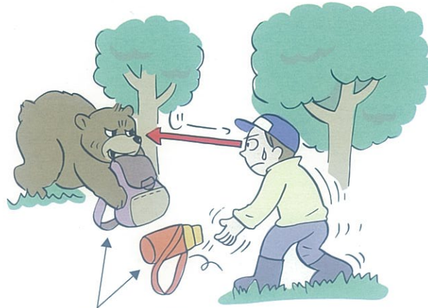
※これらの回収は自殺行為です。

クマから視線をはなさないで下さい。そしてクマの動きを見ながらゆっくりと後退して下さい。この時、リュックや服など持ち物をそっと置くとクマの気を引いて時間をかせげます。