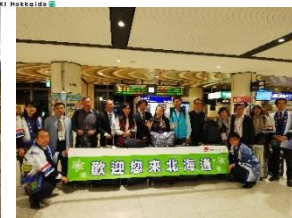
▲台湾から教育旅行視察団の来道(VJ)