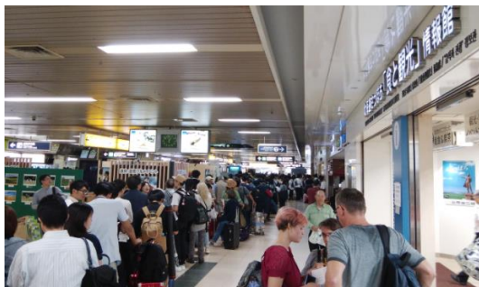
◀ JR運行再開直後のJR札幌駅券売機や改札へ並ぶ行列