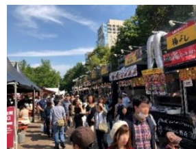
▲観光客で賑わうさっぽろオータムフェスト