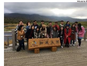
▲中国のエージェントを招請して道東の視察を実施(VJ)