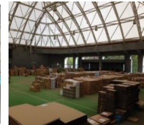
▲地域内輸送拠点（プロの仕分け）