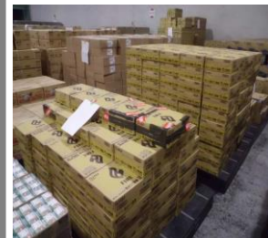
▲広域物資輸送拠点（物流事業者の施設）