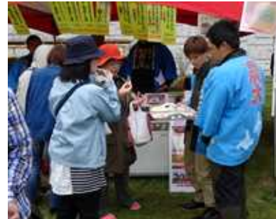
【本別山溪つつじ祭】