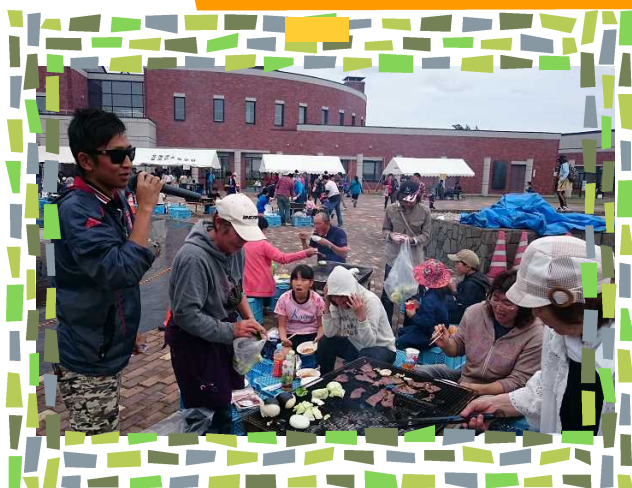
【大人気の農大牛焼き肉】