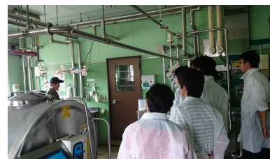
【学生が見学者を案内し、施設等を見てもらいました。入校をお待ちしています。】