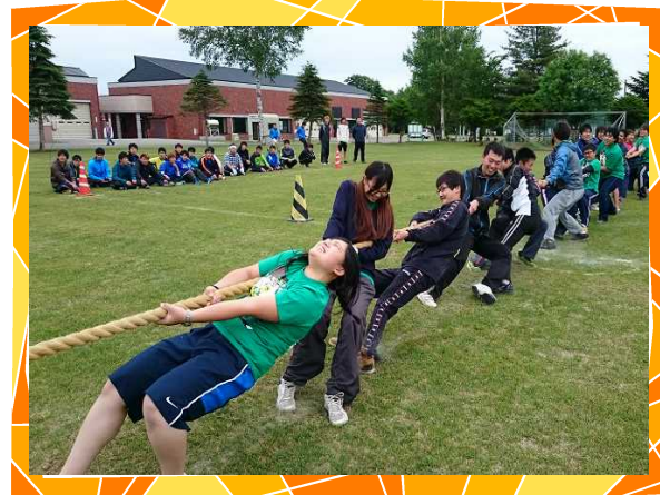
【チームワークが決め手の綱引き】