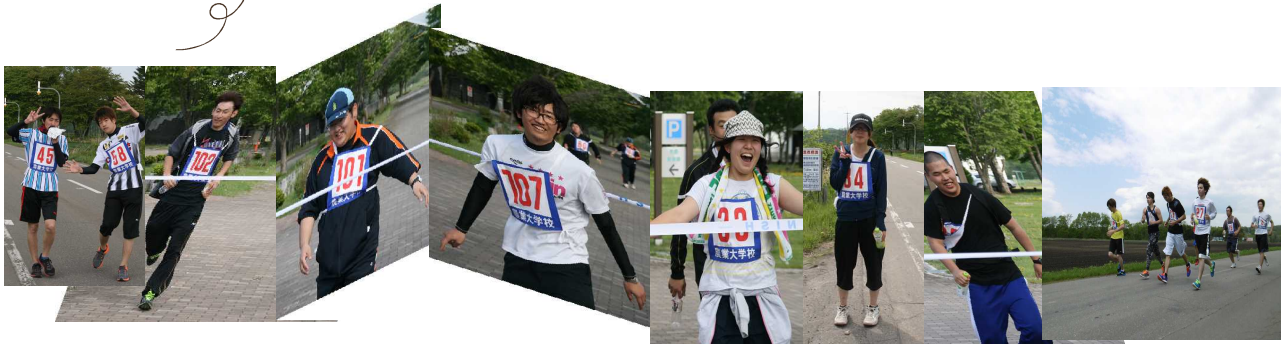
【32.195 km 「走り、歩き」きってもこの笑顔 さすが若い！】