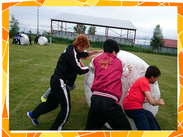
【これは重い！ロール転がし】

6月29日～30日の2日間、第42回農大祭を「祭」をテーマに開催しました。1日目は体育祭を行い、2日目の一般公開は、焼き肉やビンゴ、バンド演奏やカラオケ大会で来場された地域の皆さんもいっしょに盛り上がり、大盛況のうちに終了することができました。農大祭準備・運営に当たった、実行委員会の皆さんお疲れ様でした。