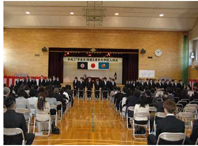
【緊張の中、式は進行】