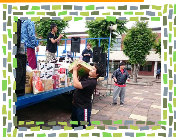
【豪華景品ビンゴ大会】

6月29日～30日の2日間、第42回農大祭を「祭」をテーマに開催しました。1日目は体育祭を行い、2日目の一般公開は、焼き肉やビンゴ、バンド演奏やカラオケ大会で来場された地域の皆さんもいっしょに盛り上がり、大盛況のうちに終了することができました。農大祭準備・運営に当たった、実行委員会の皆さんお疲れ様でした。