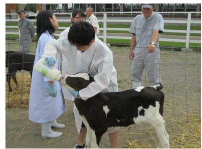
【農大の特色を学生・職員がPR、実際に作業を体験してもらいました】