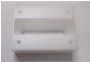
食品用機械部品（樹脂）

(主な材質) CN/POM/UHMW/他 (サイズ) 丸形状~φ300まで/ 板形状~1000Lまで (特徴・用途) 直接食品が触れる部品など、雑菌が繁殖しにくい材質を選定し、繊細な表面加工。