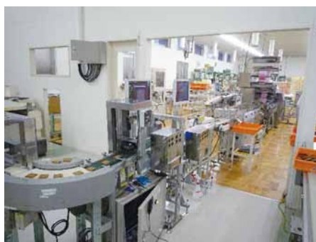
クッキー製造形状検査ライン