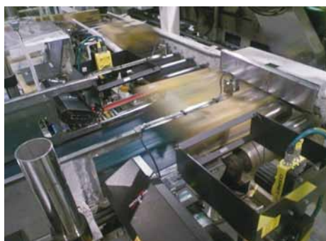
包装印字検査用画像処理装置