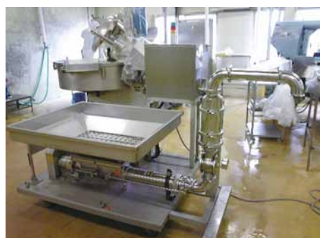
食品移送用ポンプ