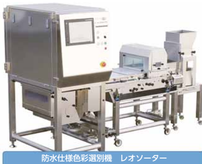
防水仕様色彩選別機 レオソーター