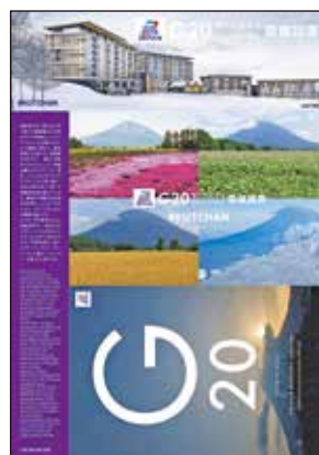
オリジナル切手フレームセット