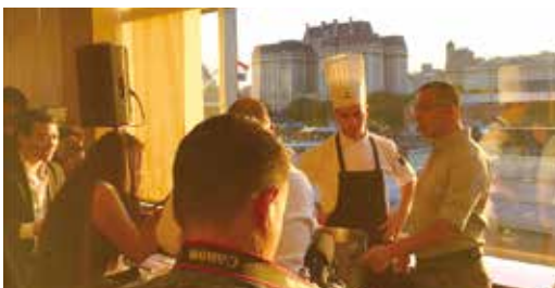
ブエノスアイレス