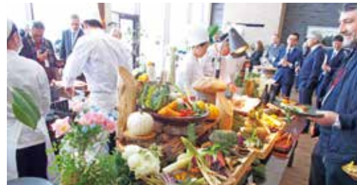
NIKI Hills 視察