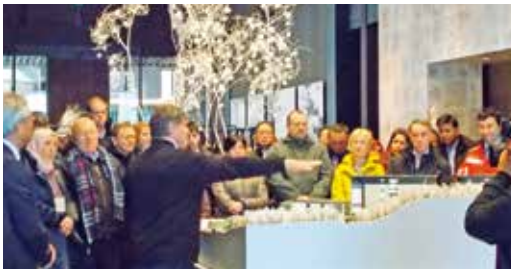
G20観光大臣会合会場視察

主な内容 2月5日～7日 函館市内視察、北海道洞爺湖サミット会場(ウィンザーホテル洞爺)視察、G20観光大臣会合会場(ニセコHANAZONOリゾート)視察、地元町長との懇親会、NIKI Hills視察、北海道知事表敬 2月8日 フォーラム出席