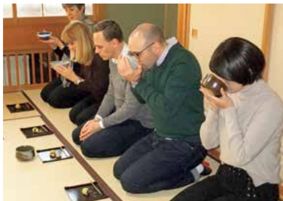
和菓子作り体験・試食