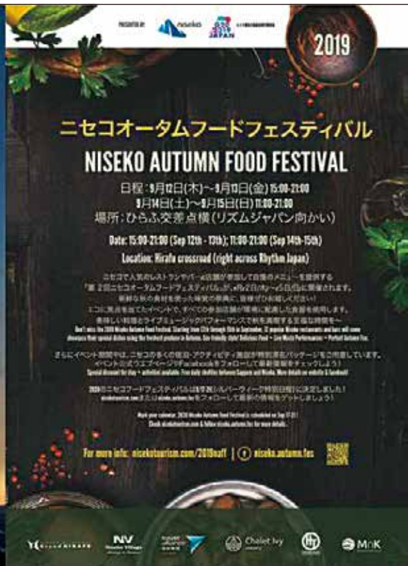
開催告知のリーフレット