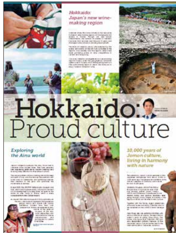
別刷した特集記事