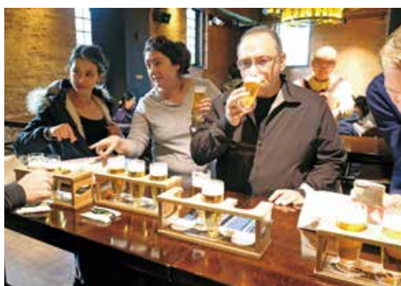
サッポロビール園にてビール飲み比べ