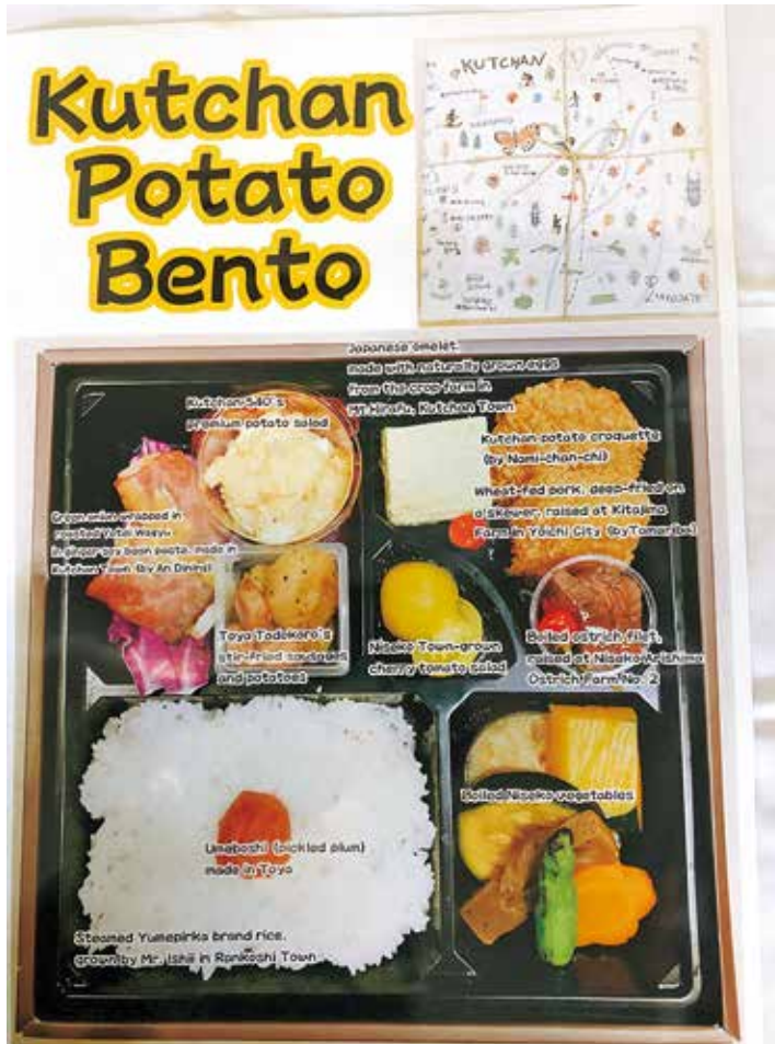
倶知安じゃがいも弁当の内容

令和元年(2019年)10月26日に、ニセコHANAZONOリゾートのSHOW SUITE棟で実施された随員昼食会において、倶知安町内の飲食店経営者等(炉ばたにせこ浪花亭、本間松藏商店など)が、G20観光大臣会合開催を契機に立ち上げた“私たちのまち弁”プロジェクトとして企画・制作した『倶知安じゃがいも弁当』を提供し、倶知安町や近郊地域産食材の魅力を各国参加者へアピールした。