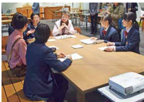
ニセコ高校生と交流