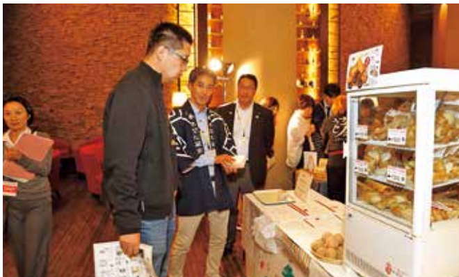
レセプション会場へ向かう各国代表団へのPR