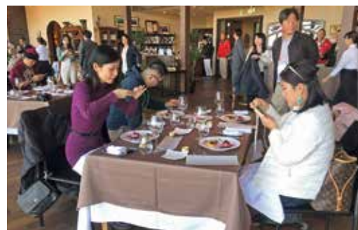
NIKI Hills Winery視察