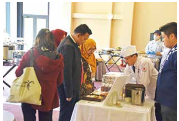
昼食会での弁当の提供