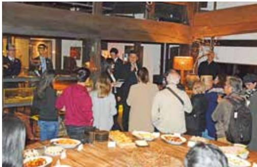
ウェルカムレセプション