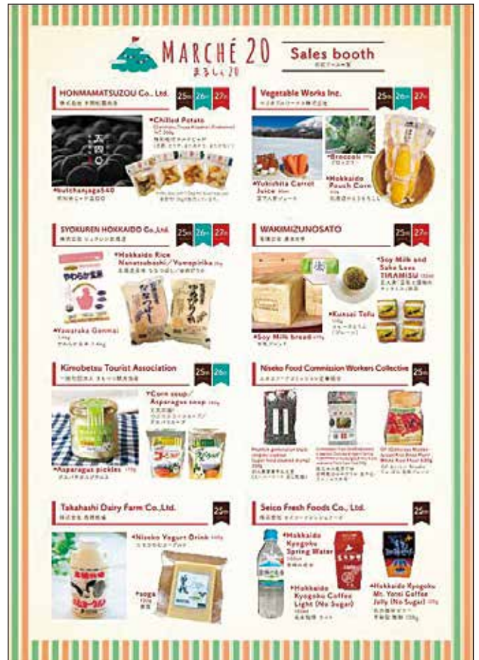
開催告知のリーフレット