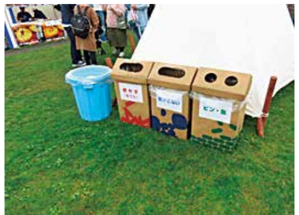
環境保全を意識した段ボールのごみ箱