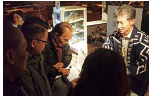
まるしえ20(第3弾)視察