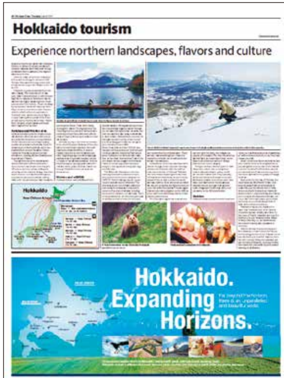
G20大阪サミット特集号に掲載した広告

広告の内容に加え、北海道が誇る文化に関する特集記事を別刷(1,000部)し、各国代表団向けのウェルカムギフトの一つとして配布した。