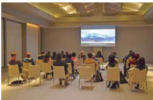
G20観光大臣会合会場視察