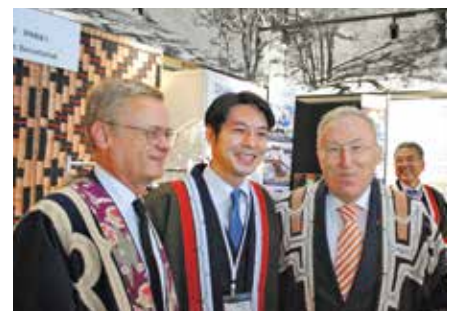
アイヌ民族衣装の試着