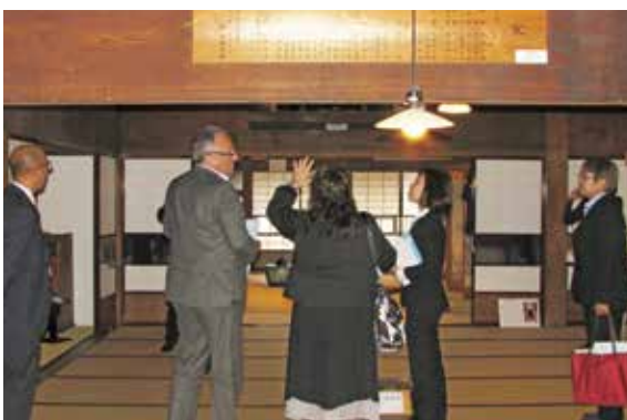
鯨御殿とまり見学