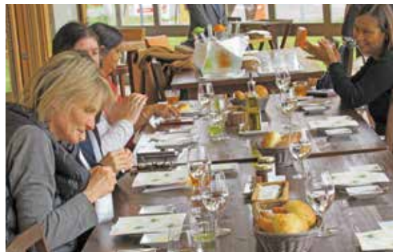
ヴィラルピシアにて昼食