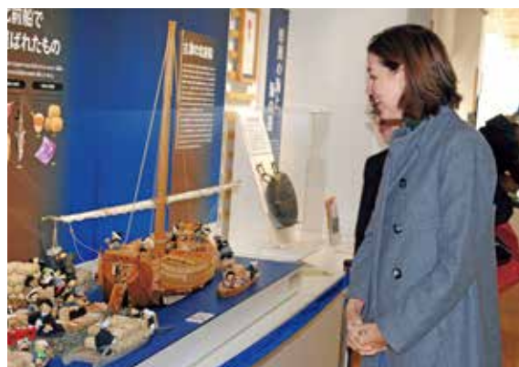
「石狩」あいろんど厚田で北前船展示を見学