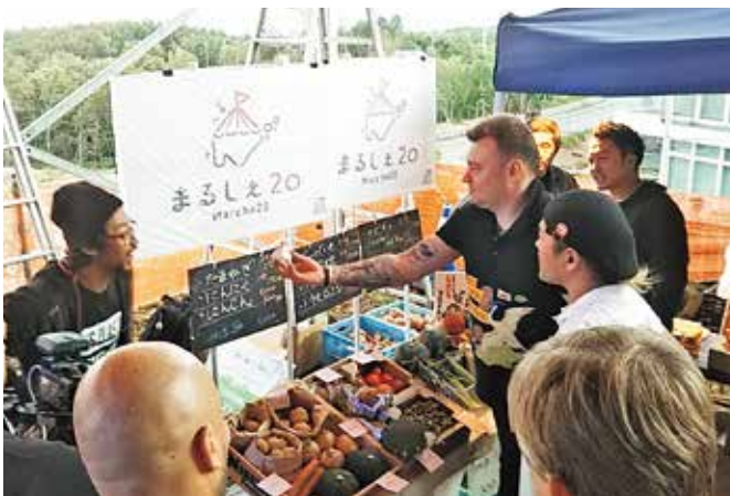
海外メディアによる取材