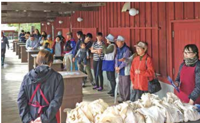
採れたて野菜の先着プレゼント