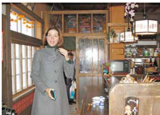
ふるさと歴史通り散策