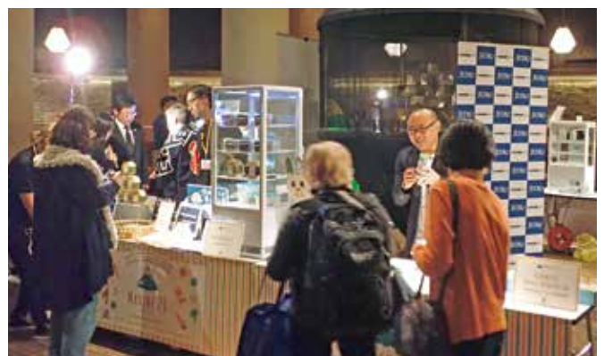
プレスツアー参加者へのPR