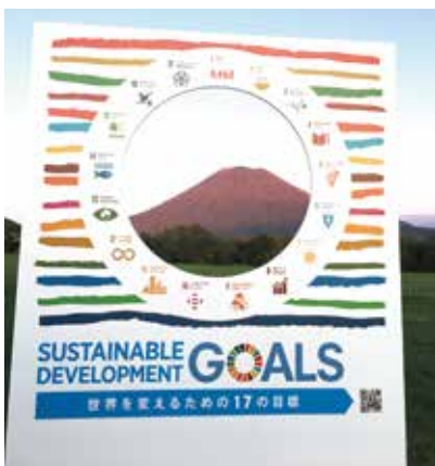
撮影フォトパネルの設置