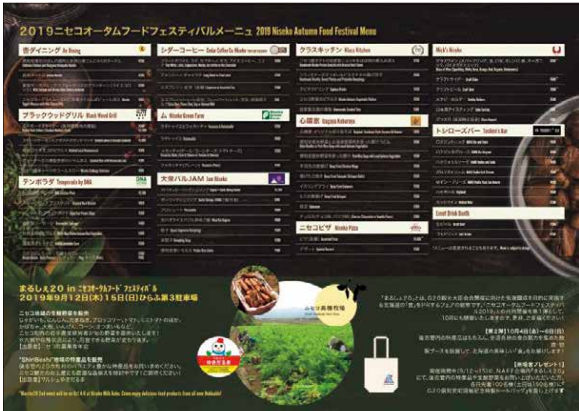
開催告知のリーフレット

(第2弾) 日程 令和元年(2019年)10月4日~6日 場所 ニセコ高橋牧場(ニセコ町曾我888の1)