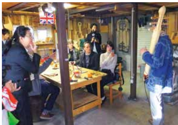
トンコリ演奏視聴