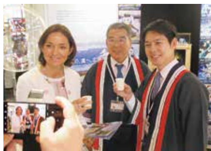
北海道銘菓の試飲食