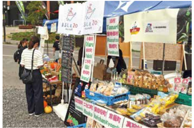
特産品、生鮮野菜の販売