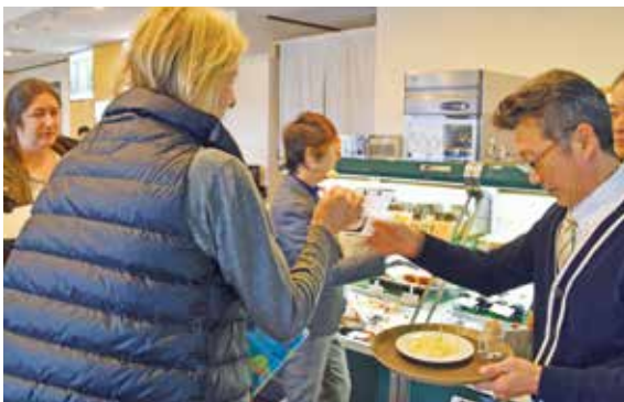
トワ・ヴェールにて手作り食品の試食