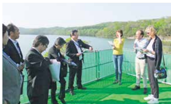
民族共生象徴空間(ウポポイ)視察