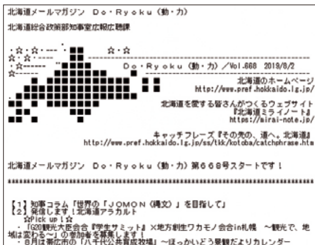
メールマガジン「Do・Ryoku」(全6回掲載)