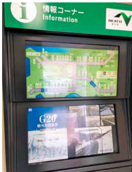
デジタルサイネージでの放映 (東日本高速道路(株))