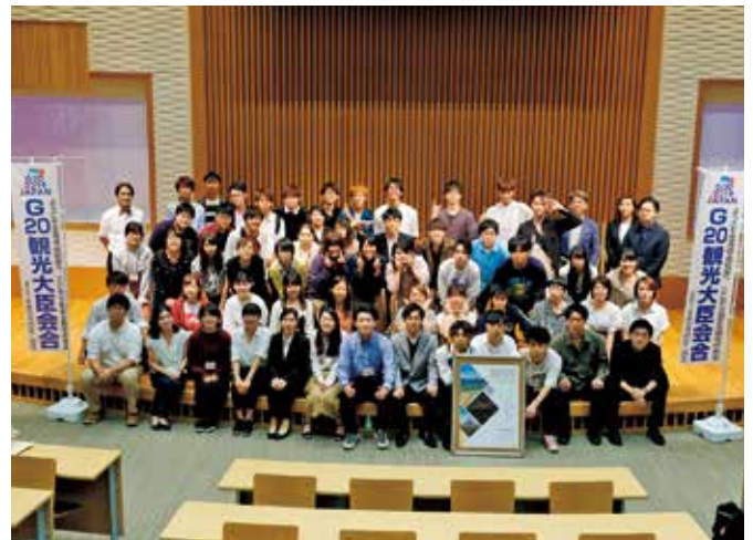
学生サミット参加の学生たち