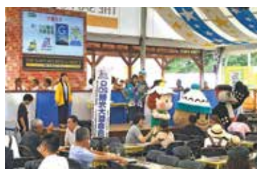
THE サッポロビヤガーデン