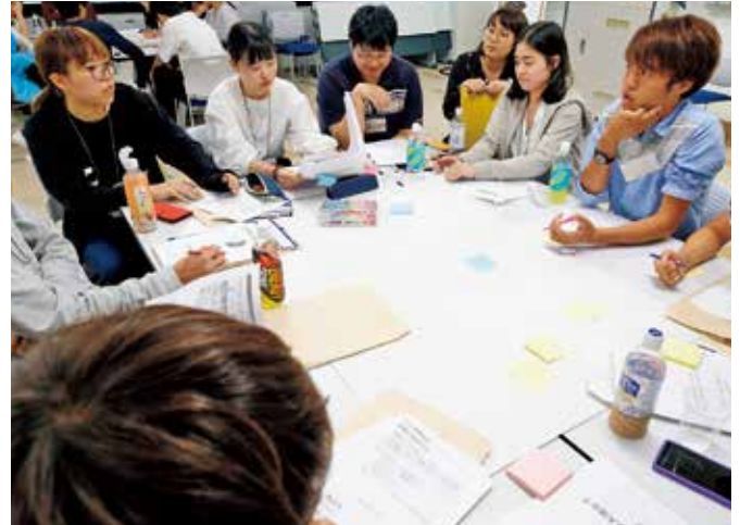
第2部 グループ討論