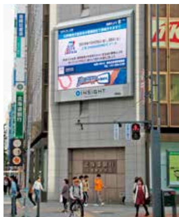
街頭大型ビジョンでの放映 ((株)メガ・コーポレーション)