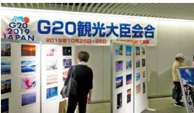
写真コンテストの作品展示