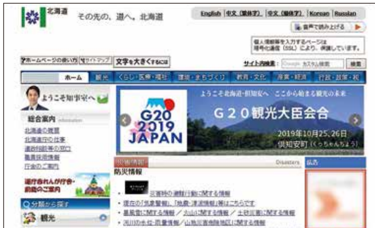
道ホームページトップページ