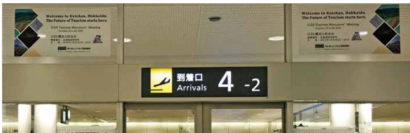
1階手荷物受取所出口