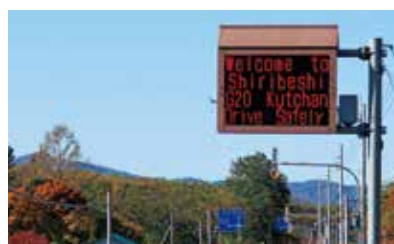
道路情報板での表示