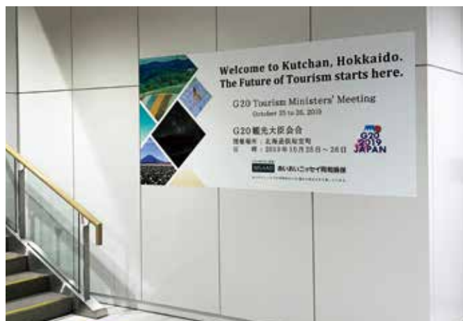
1階制限区域内階段付近