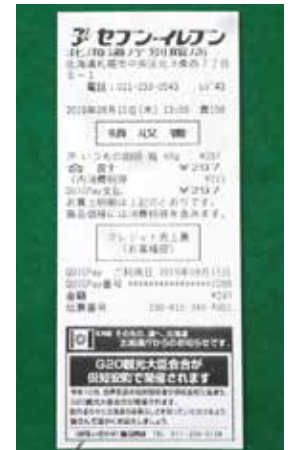
レシートへの掲載 ((株)セブンイレブ・ ジャパン)