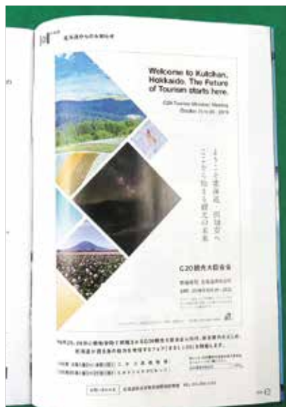
雑誌「JPO1」への掲載 (総合商研(株))