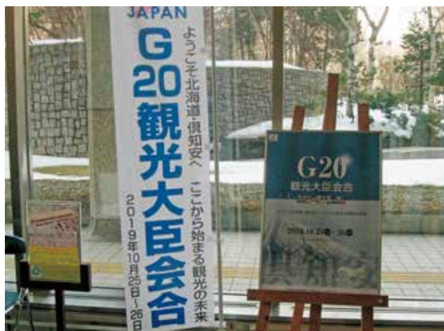
道庁本庁舎1階 道政広報コーナー