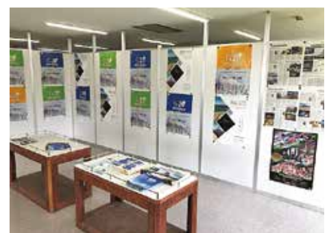
PRブースの設置 (ヤマト運輸(株))