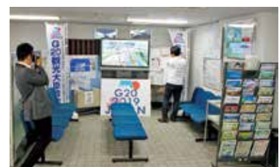
小樽開発建設部庁舎PRコーナー