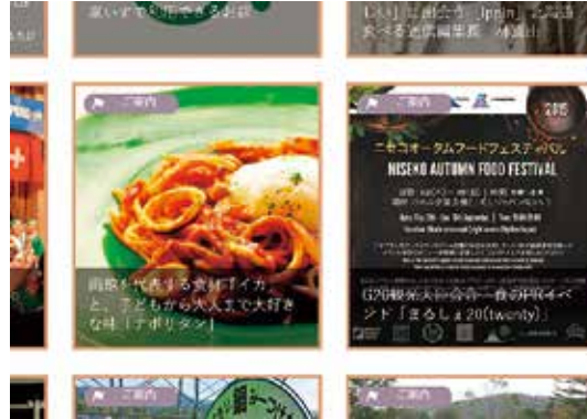
ホームページへの掲載 ((株)ぐるなび)