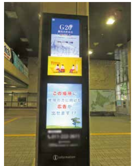
デジタルサイネージでの放映 (表示灯(株))