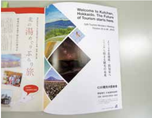
雑誌「北海道生活」への掲載 ((株)えんれいしゃ)