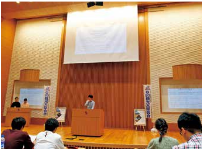
学生サミット宣言発表