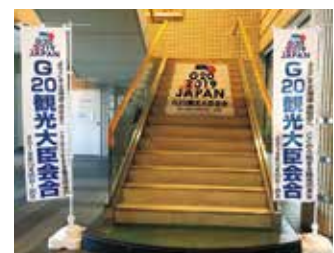
共和町役場庁舎での階段装飾