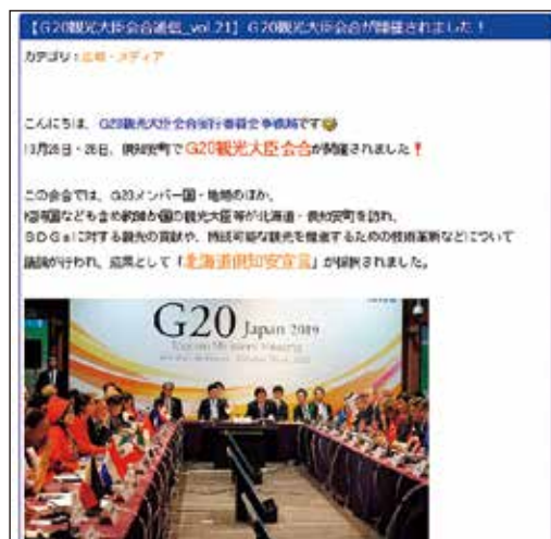
G20観光大臣会合通信(全21回掲載)