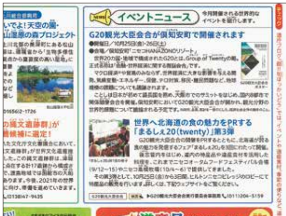
広報紙「ほっかいどう」11月号(10月9日発行)