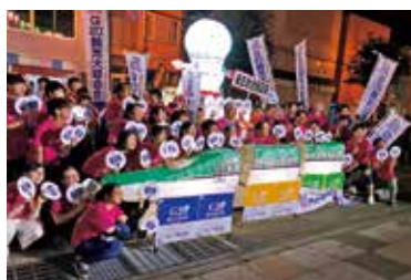
くっちゃんじゃが祭り