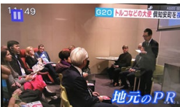
北海道放送 2/7 「ひろおびJNNニュース」 大使達のG20会場視察