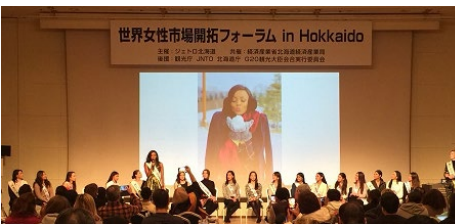
▲世界女性市場開拓フォーラム 招聘者登壇 2/8