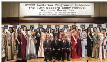
▲雪まつりに関するブリーフィング・レセプション 辻北海道副知事、秋元札幌市長、JETRO前田理事出席 2/7 17:30-19:00（札幌グランドホテル）

2/26 プエノス、モスクワ 2/27 サンパウロ（外務省ジャパンハウス）3/1 ウルグアイ（日本国大使公邸）3/16 ケープタウン（日本領事館ジャパンデー）合計5カ国にて、招聘者による凱旋講演を実施。