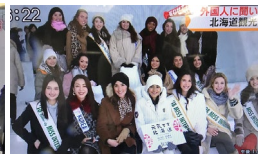
札幌テレビ放送 2/7 「どさんこワイド719」 氷の然別湖コタンの様子