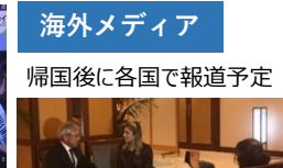
海外メディア 帰国後に各国で報道予定