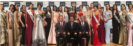
▲ディナーレセプション 2/7