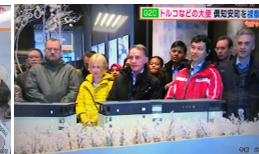
北海道放送 2/7 「きょうドキッ！」大使達によるG20会場視察の様子