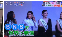
北海道放送 2/8 「きょうドキッ！」世界女性市場開拓フォーラムの様子