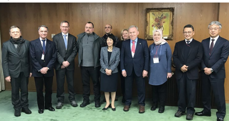
▲高橋知事表敬（前田理事、大使8名：インドネシア、アルゼンチン、トルコ、ポーランド、ルーマニア、クロアチア、ブルガリア、ルクセンブルク）2/7