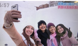
NHK札幌放送局 2/7 「ほっとニュース北海道」 雪まつり・大雪像視察の様子

NHK、札幌テレビ放送、北海道放送、十勝毎日新聞、北海道新聞、函館新聞、室蘭民報、共同通信等、多くのメディアが取材