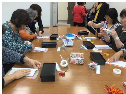
着物を利用したワークショップ