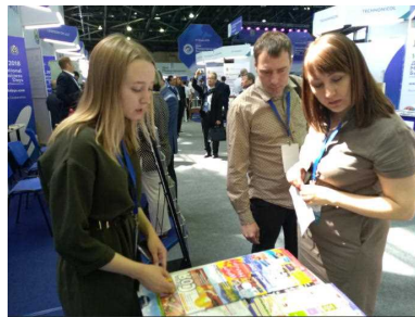
北海道ブースでのPR