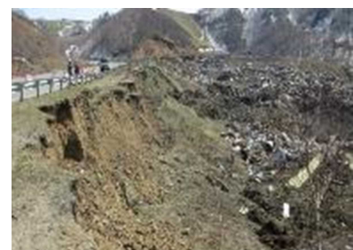
ホルムスクにある埋立て場