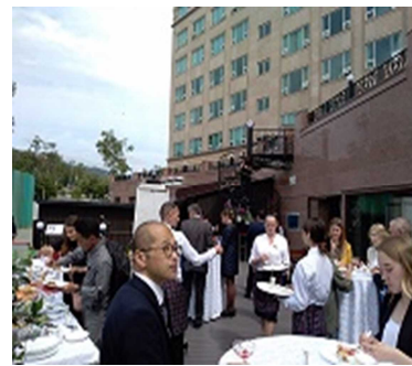
レセプション風景