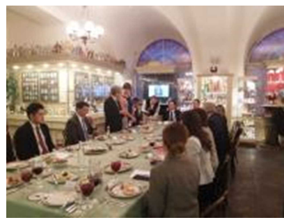
グレゴリエフ委員長公式夕食会