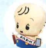
国勢調査 イメージキャラクター センサスくん