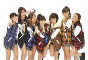
公式応援団 アップアップガールズ(仮)